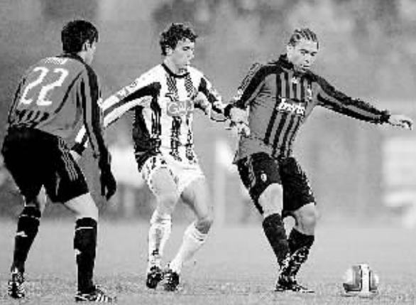
1月20日, AC米兰队球员罗纳尔多(右)在比赛中控球。当日, 在意甲联赛第19轮比赛中, AC米兰队客场以1:0战胜乌迪内斯队。