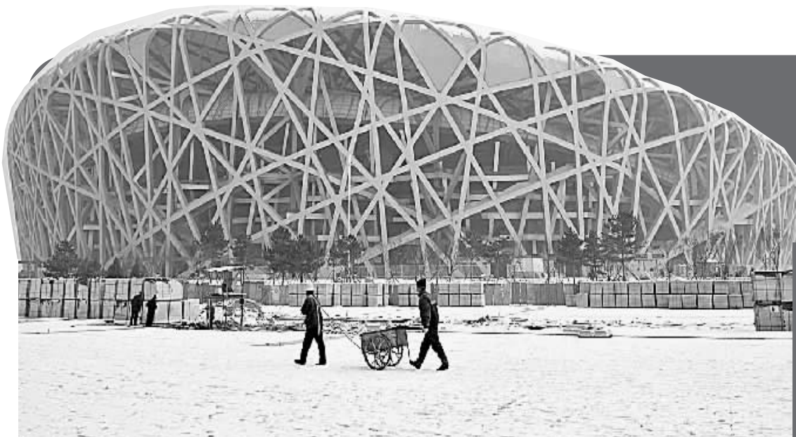
上图:1月18日,一场降雪把“鸟巢”的施工工地变成一片银装素裹的世界。右图:1月23日,工人们在清洁“水立方”顶部。奥运会后,这两座建筑和其他一些奥运场馆和设施,将成为北京市新的地标性建筑。