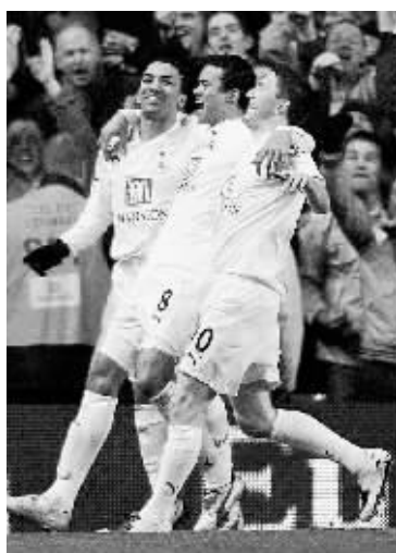
1月22日,托特纳姆热刺队球员庆祝进球。当日,在英格兰足球联赛杯半决赛次回合较量中,阿森纳队客场以1:5负于托特纳姆热刺队。新华社发