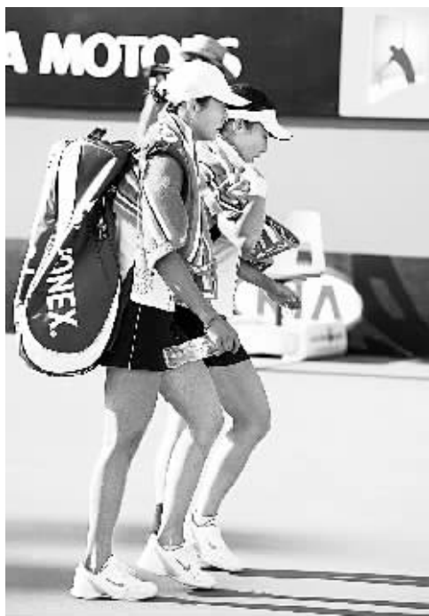
1月23日,中国选手郑洁(右)、晏紫赛后离场。当日,郑洁/晏紫在2008澳大利亚网球公开赛女双半决赛中,以1:2负于跨国组合白俄罗斯选手阿扎莲卡/以色列选手佩尔,无缘决赛。