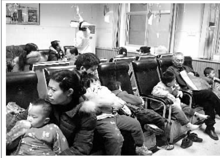
近日,郑州市中心医院儿科就诊患儿显著增多。