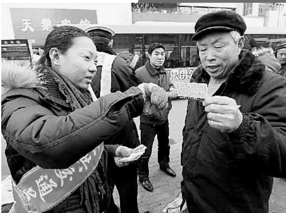
昨日,在郑州火车站,公交公司工作人员和特巡警将印有如何防盗、防骗等内容的“安全卡”向返乡的农民工发放。