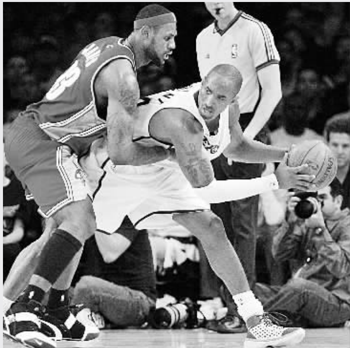
1月27日,克里夫兰骑士队球员詹姆斯(左)在比赛中防守洛杉矶湖人队球员科比。当日,在NBA常规赛的一场比赛中,克里夫兰骑士队客场以98:95战胜洛杉矶湖人队。