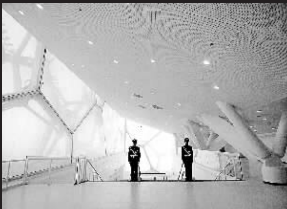
国家游泳中心内部走廊。

新华社北京1月28日专电(记者 高鹏 孙晓胜)历经4年多的建设,北京奥运会标志性建筑之一——国家游泳中心(“水立方”)28日上午竣工并交付使用。