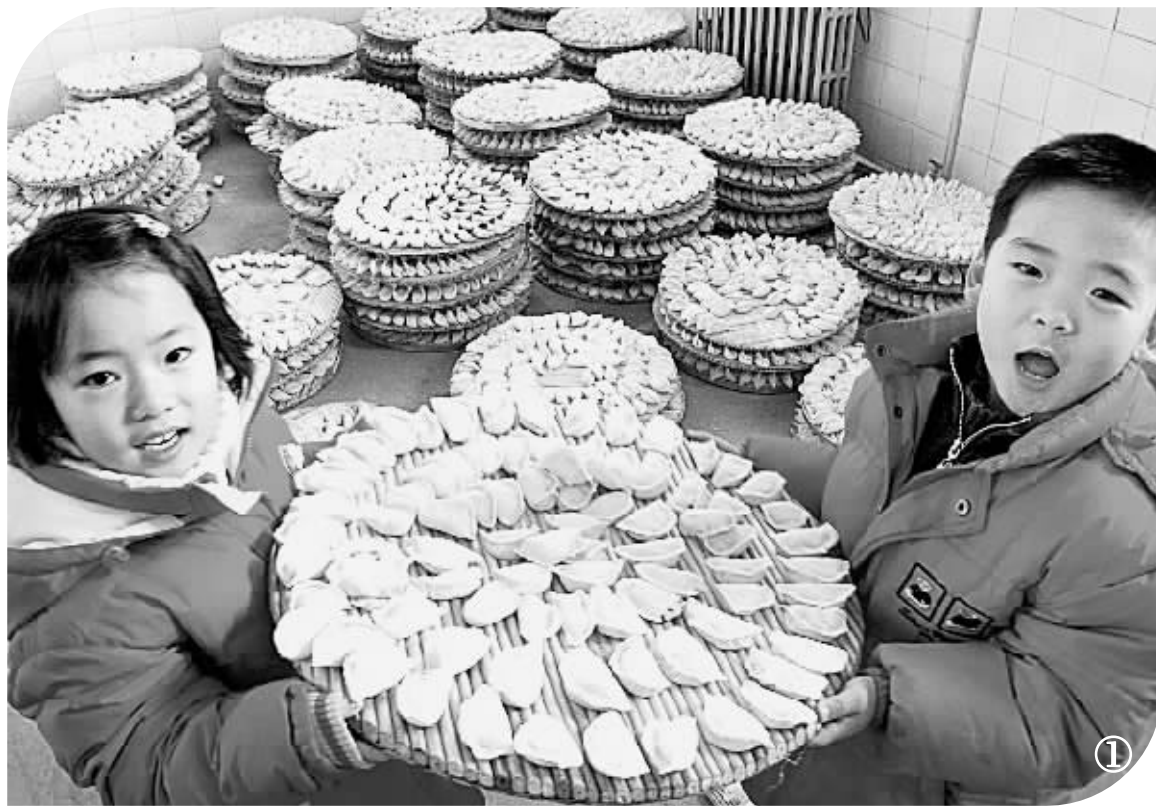
① 2月6日,两名小朋友端起包好的饺子。当日,北京市大兴区长子营镇留民营村的千余名村民共赴饺子宴,迎接新春佳节。

沙马内阁由人民力量党、泰国党、为国党、中庸民主党、泰人同心国家发展党和人民党联合组成。