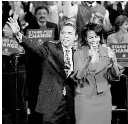
5日,美民主党总统竞选人奥巴马(左)在芝加哥举行的“超级星期二”美国总统预选中向支持者致意。