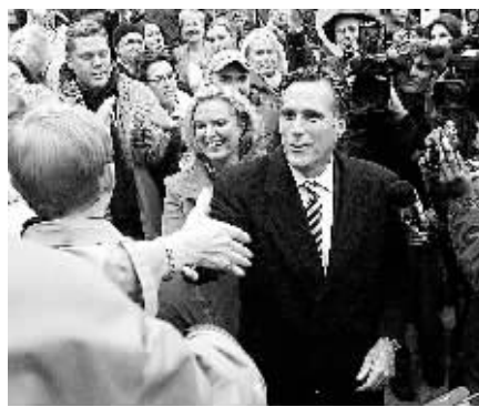
5日,美共和党总统竞选人、马萨诸塞州前州长罗姆尼在贝尔蒙特抵达一投票站时与支持者握手。