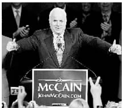
5日,在美国亚利桑那州菲尼克斯举行的“超级星期二”美国总统预选中,共和党总统竞选人麦凯恩向支持者致意。