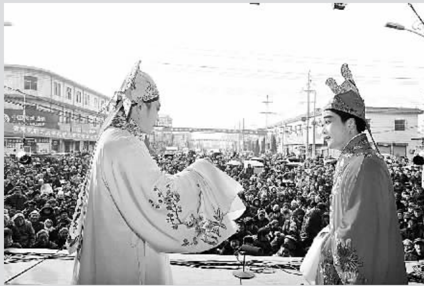
大年初一,二七区马寨镇举行盛大的文化活动,为村民献上丰盛的文化大餐。