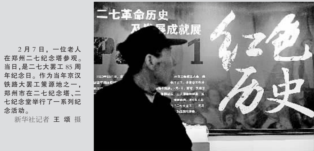
2月7日,一位老人在郑州二七纪念馆参观。当日,是二七大罢工85周年纪念日。作为当年京汉铁路大罢工策源地之一,郑州市在二七纪念馆、二七纪念馆堂举行了一系列纪念活动。