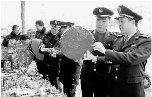
春节期间,巩义市工商局执法人员对烟花爆竹市场进行专项检查,严查质量低劣、存在重大安全隐患产品。

一些建筑企业层层转包,包工头携款逃跑;农民工拿不出相关凭证,在工钱多少上与建筑方有较大分歧;建筑单位以工程质量纠纷为由拖延支付工程款和农民工工资。针对这些问题,全省劳动保障部门开展了用人单位签订劳动合同和集体合同专项执法检查、农村地区“四小”企业用工情况专项检查、清理整顿人力资源市场秩序专项执法检查等活动。