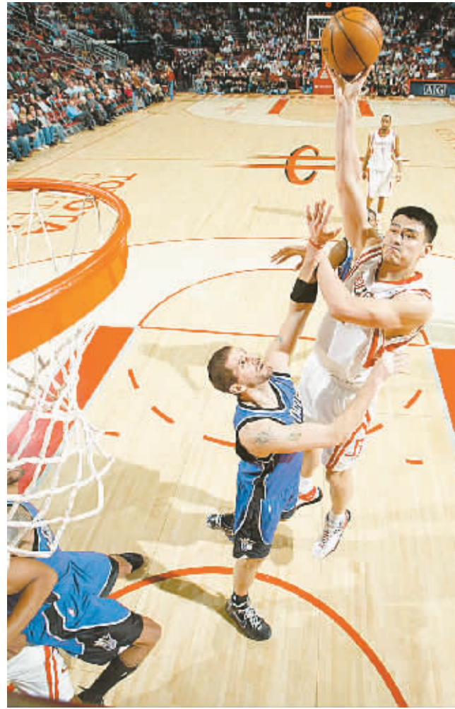
休斯敦火箭队球员姚明(右一)在比赛中投篮。当日,在NBA常规赛中,休斯敦火箭队主场以89:87战胜萨克拉门托国王队,取得八连胜。

当日其他场次的比赛中,多伦多猛龙队主场109:91击败新泽西网队;费城76人以102:88战胜孟菲斯灰熊队;夏洛特山猫队以100:98险胜亚特兰大老鹰队;奥兰多魔术队以109:98击败丹佛掘金队;克里夫兰骑士队主场105:112不敌圣安东尼奥马刺队;新奥尔良黄蜂队客场111:107战胜密尔沃基雄鹿队;休斯敦火箭队主场89:87险胜萨克拉门托国王队;小牛队96:76大胜波特兰开拓者队;金州勇士队以120:118战胜菲尼克斯太阳队;西雅图超音速队主场93:112不敌犹他爵士队;华盛顿奇才队91:89击败洛杉矶快船队。