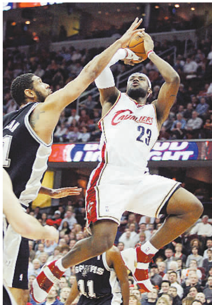
克利夫兰骑士队球员詹姆斯(右)在比赛中投篮。当日,在NBA常规赛中,圣安东尼奥马刺队客场以112:105战胜克利夫兰骑士队。