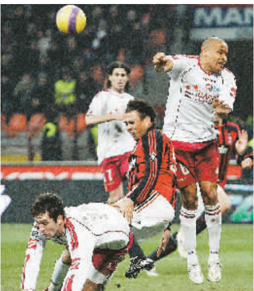
2月13日,AC米兰队球员罗纳尔多(前中)与里昂队球员克内热维奇(左)、维迪加尔(右)拼抢。当日,在意甲联赛的一场比赛中,AC米兰队主场以1:1战平里昂队。

8年前,罗纳尔多在膝部受伤后整整休养了20个月,才在2002年世界杯赛上复出,帮助巴西队第五次赢得世界杯冠军。罗纳尔多今年31岁,他和AC米兰队的合同在本赛季未到期。