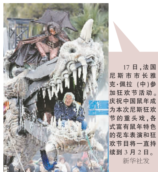
17日,法国尼斯市市长雅克·佩拉(中)参加狂欢节活动。庆祝中国鼠年成为本次尼斯狂欢节的重头戏,各式富有鼠年特色的花车表演和狂欢节目将一直持续到3月2日。

农业部官员估计,这批牛肉中约有3700万磅(1.7万吨)卖给了学校,大部分牛肉已被消费掉。不过,目前学生中没有出现与这批牛肉有关的疾病。