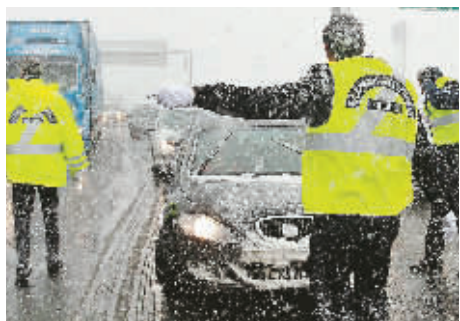
17日,警察在雅典通往希腊北部地区的公路上疏导车辆。希腊当日遭受暴雪袭击,全国交通受阻,部分地区停水断电。希腊内政部门宣布全国进入紧急状态。

由总理沙马·顺达卫宣读的这份施政纲领确立泰国国王普密蓬·阿杜德提出的自足经济理论为政府制定各项政策的基本原则。沙马说,纲领将以恢复社会和谐为首要任务,包括弥合社会矛盾、恢复和谐社会环境、建立长期稳定社会。政府将着力解决持续数年的泰南暴力冲突问题。