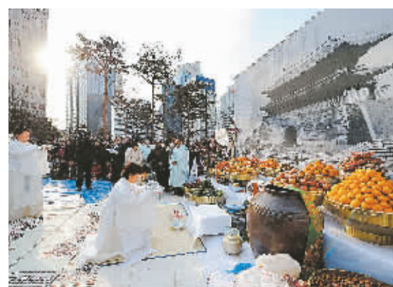
18日,在韩国首都首尔,身着传统服装的韩国妇女在祭祀被烧毁的崇礼门。当天下午,几百名韩国民众聚集在11日被烧毁的国宝崇礼门前,以传统方式举行祭祀活动。

据新华社专电 中国驻菲律宾大使馆18日证实,一艘载有28名中国大陆船员的巴拿马籍船18日凌晨在菲律宾吕宋岛北部海域沉没,26名船员被救商船及时救起,另外两人截至18日晚间仍下落不明。中国驻菲律宾大使馆领事官员称,这26名中国船员都是被附近一艘日本油轮救起的,货船的船长和轮机长则留在不断下沉的货船上作最后的抢救努力。据中国海上搜救中心和菲律宾海岸救援队提供的消息,货轮为“JIN SHAN”号,17日在从所罗门群岛开往中国江苏的途中驶经菲律宾北部海域时遇险,18日凌晨3点左右完全沉没,船上海事卫星电话先是无人接听,后显示用户关机,与该船的联系完全中断,滞留失事船上的两人下落不明。