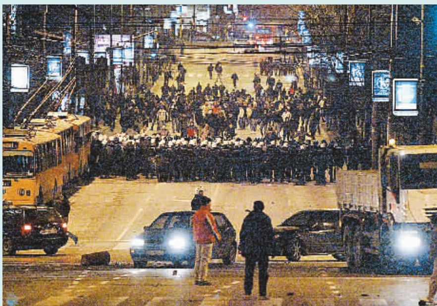
17日,塞尔维亚首都贝尔格莱德爆发示威活动,抗议科索沃独立。