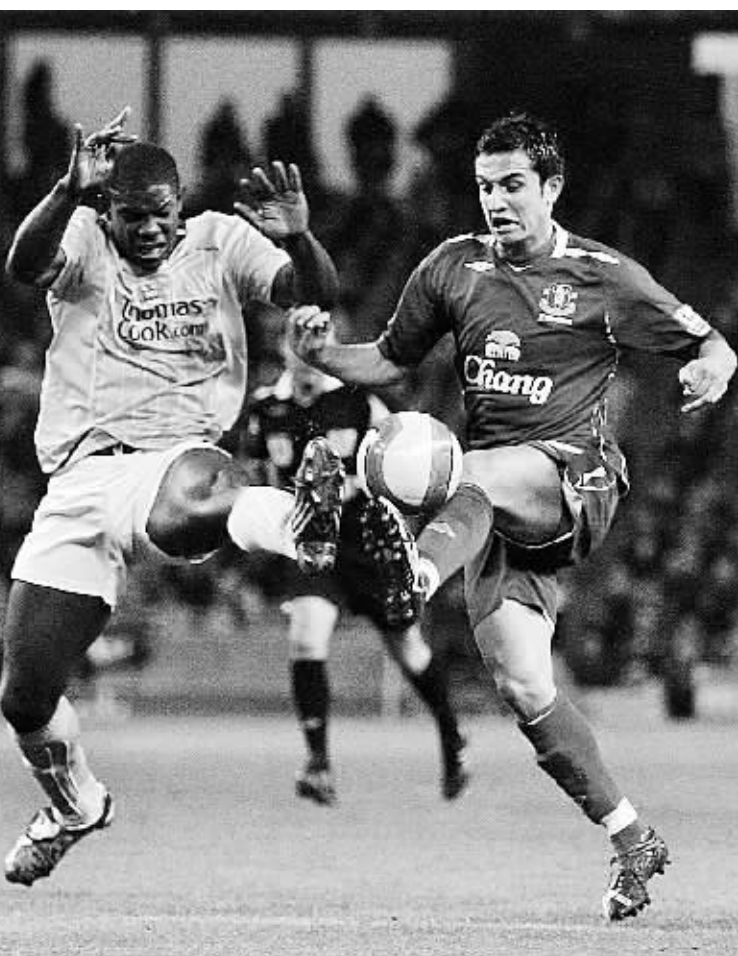
2月25日,埃弗顿队球员卡希尔(右)与曼城队球员理查兹拼抢。当日,在英格兰足球超级联赛第27轮比赛中,埃弗顿队客场以2:0战胜曼彻斯特城队。