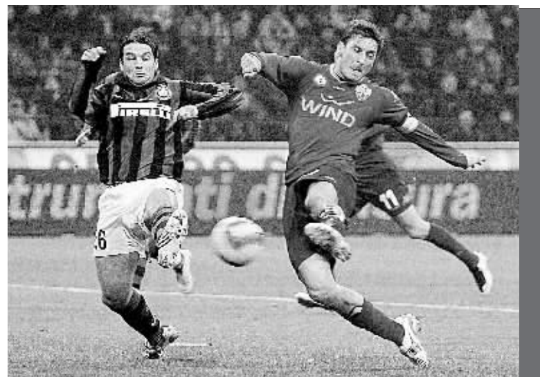
2月27日,罗马队球员托蒂(右)射门得分。当日,在意大利足球甲级联赛第25轮比赛中,国际米兰队主场以1:1与罗马队战平。

应战的河南男排并未给老到的辽宁男排制造足够的麻烦,很快便以17:25、22:25和15:25败下阵来。丢掉本场比赛意味着河南男排夺取本赛季冠军的难度将大大增加。今天,河南男排将迎战四川男排。