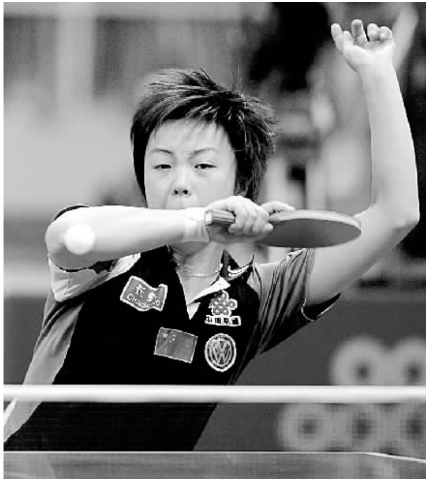
中国队选手张怡宁在比赛中回球。