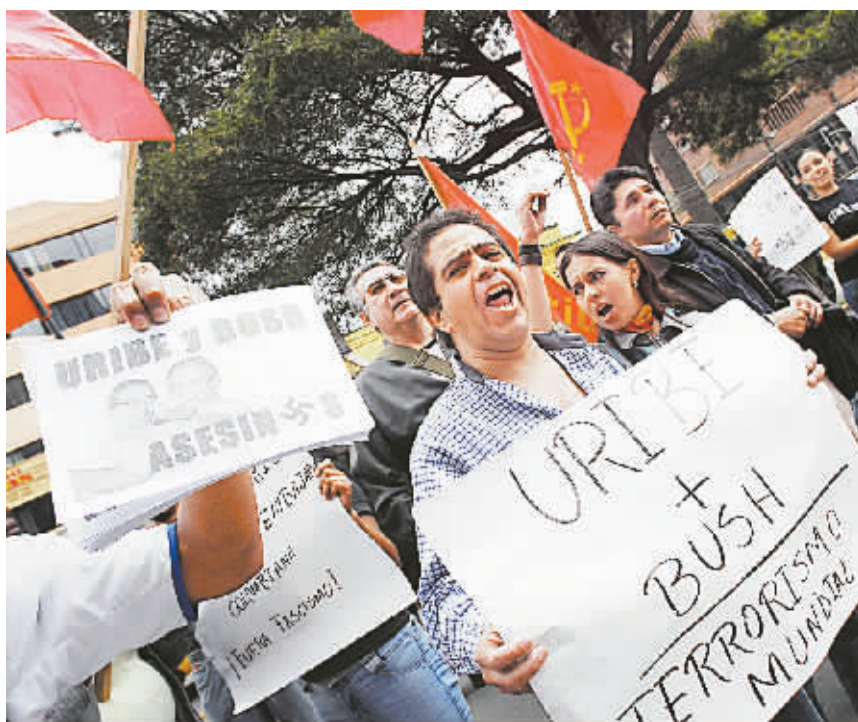
3日,在厄瓜多尔首都基多,示威者在哥伦比亚使馆门前高呼抗议口号。

厄瓜多尔3日宣布与哥伦比亚断交,委内瑞拉也宣布委驻哥大使馆从3日起无限期关闭。厄、委两国同时增兵哥边境地区,局势骤然紧张。