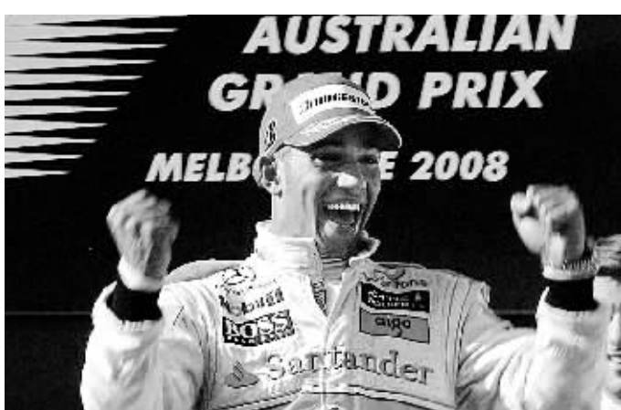
3月16日，迈凯轮车队英国车手汉密尔顿庆祝胜利。当日，在2008新赛季世界一级方程式锦标赛(F1)澳大利亚大奖赛中，汉密尔顿以1小时34分50秒616的成绩获得冠军。