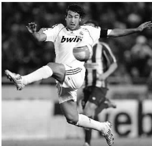
3月15日，皇家马德里队队员劳尔在比赛中停球。当日，皇家马德里队在西班牙足球甲级联赛第28轮比赛中客场以0:1不敌拉科鲁尼亚队。