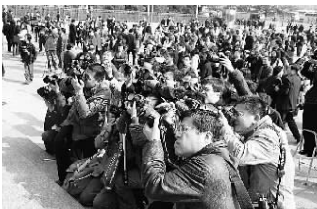
14日,全国政协十一届一次会议闭幕,摄影记者们聚集在北京人民大会堂东门外,扎成一堆,自成一景。