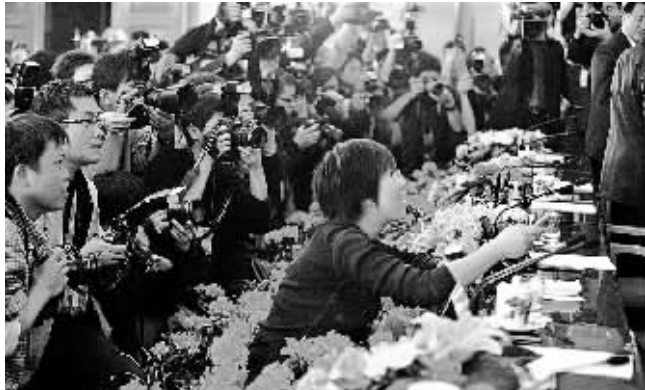
12日,全国政协十一届一次会议举行的记者招待会结束时,一名女记者先人一步,上前提问。