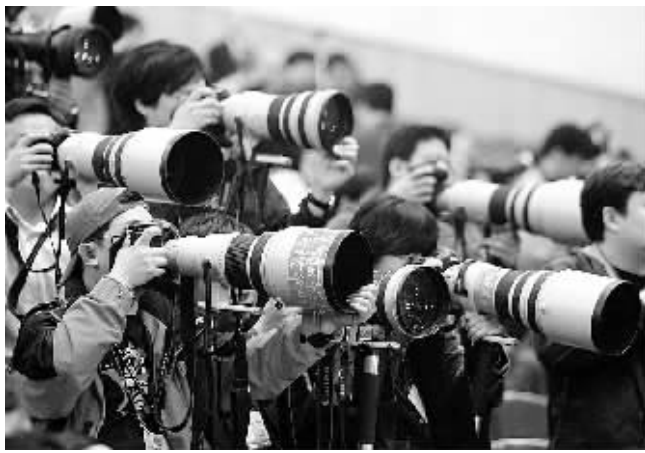
16日,十一届全国人大一次会议第六次全体会议在北京人民大会堂举行,摄影记者们架设好镜头,严阵以待,准备捕捉决定性瞬间。