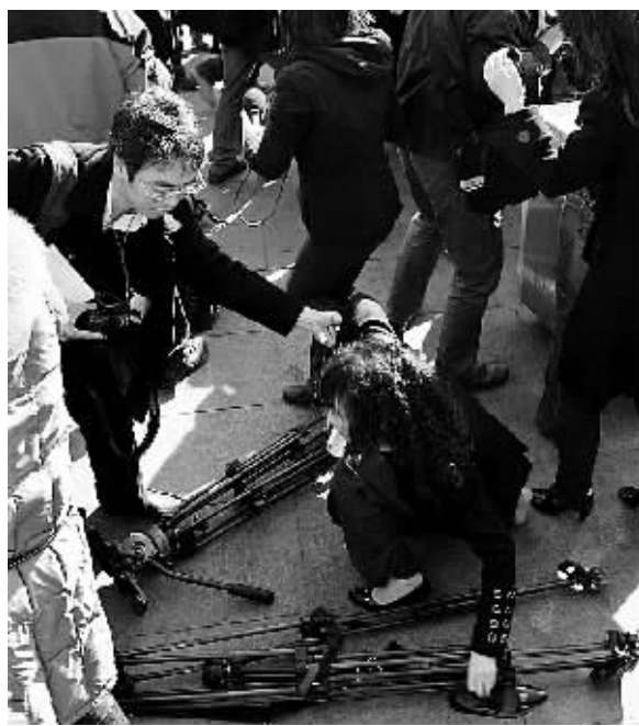
3日,全国政协十一届一次会议开幕,在北京人民大会堂东门外广场,记者们追逐采访政协委员,一名女记者在拥挤人群中摔倒。