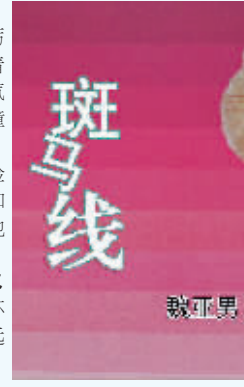
斑马线 魏亚男 著

戈非的目光停留在这片湖水上:“不过才四年,我真有些认不出来了,那片湖过去还是郊外,现在周围挤满了建筑。”