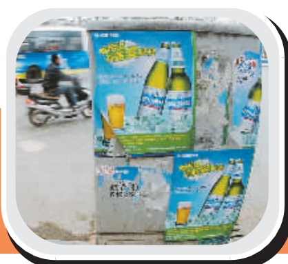
上贴满广告。街头电话箱。