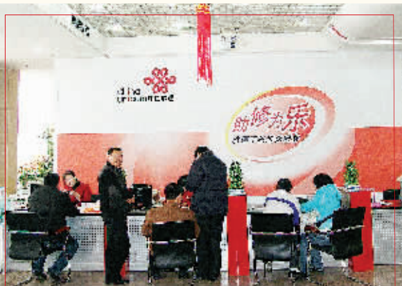
郑州联通开展“助修为乐”手机维修活动。

所有汗水都会获得回报。2007年，花园路、新密、上街、巩义4个营业厅被省联通评为“明星班组”；3人荣获省联通“明星个人”；4人荣获市联通“明星营业厅经理”；5人荣获市联通“明星营业员”；3人荣获市联通“综合与管理先进个人”；2人荣获“郑州联通业务技术骨干”；“郑州联通业务技术标兵”等光荣称号；连续两年在省联通全年营业考核中排名位居全省第一；淮河路营业厅荣获“全国电信服务明星班组”光荣称号。2008奥运年，相信郑州联通的客服工作将会做得更好，将在联通这个大舞台上亮出更美的风采。