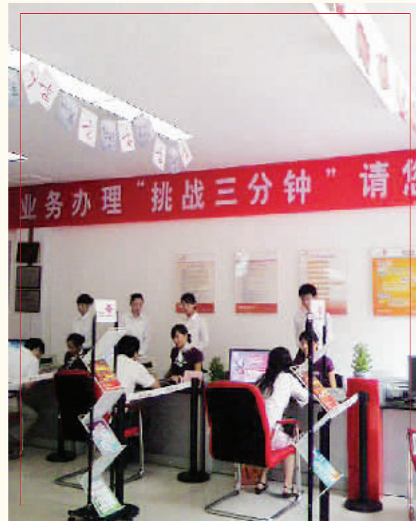
郑州联通开展“挑战三分钟”活动，解决客户办理业务排队时间长问题。

出现身着统一联通工作服的营业员们排着整齐的队伍在营业厅外进行团队宣誓；这支年轻充满朝气与蓬勃、散发着激情与火热的团队将新的一天、新的心情带给每一位联通的客户；用发自内心的真诚的笑容、朴实的话语、新的形象感动着每一位联通的客户。