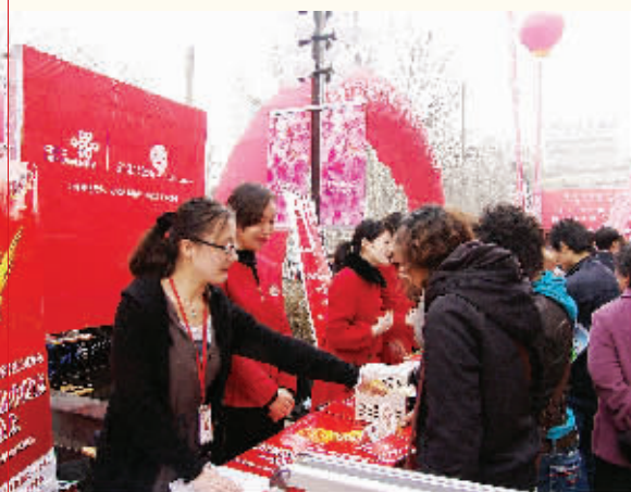
3·15期间，郑州联通开展广场活动接待客户投诉、咨询。