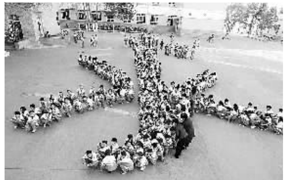
3月21日,新疆哈密市五中参加节水宣传活动的学生在校内组成“水”字图案。为迎接“世界水日”,新疆哈密市五中举办了“像爱护眼睛一样珍惜水资源”的节水宣传活动。

《办法》中规定,看守所对罪犯的劳动时间,参照国家有关劳动工时的规定执行。罪犯有在法定节日和休息日休息的权利。看守所应鼓励罪犯自学。另外,罪犯可以参加国家举办的高等教育自学考试。(郝涛)