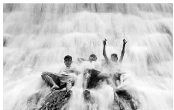
3月22日,在菲律宾蒙塔万市的瓦瓦水坝,当地儿童享受在瀑布中沐浴的乐趣。

萨科齐指出,法国将继续奉行核威慑政策,所有侵犯法国重要利益的人将遭到沉重的核打击。但他同时表示,法国将在满足战略需求的前提下,尽可能少地储备核武器。