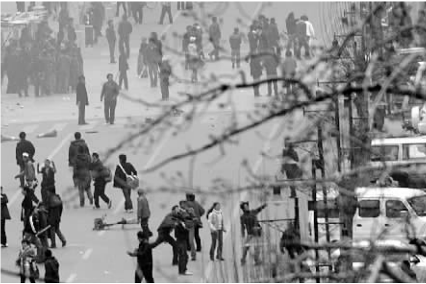
14日中午,在拉萨朵森格路,不法分子在向路边商铺、汽车扔石头。

秦刚表示,西藏自治区政府依法处置拉萨严重暴力犯罪事件以来,已有近一百个国家政府公开或向中方表示,支持中方为维护国家主权、领土完整和西藏稳定采取的行动,谴责暴力犯罪行径及其幕后策划者。这足以证明国际社会是站在中国一边。公道自在人心。一些人企图利用达赖达到不可告人的目的是不会得逞的。