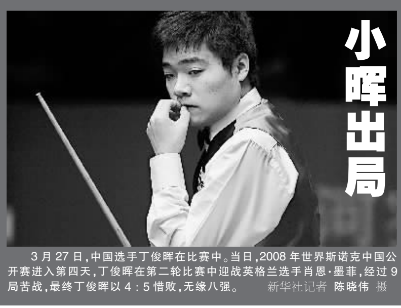
3月27日,中国选手丁俊晖在比赛中。当日,2008年世界斯诺克中国公开赛进入第四天,丁俊晖在第二轮比赛中迎战英格兰选手肖恩·墨菲,经过9局苦战,最终以4:5惜败,无缘八强。