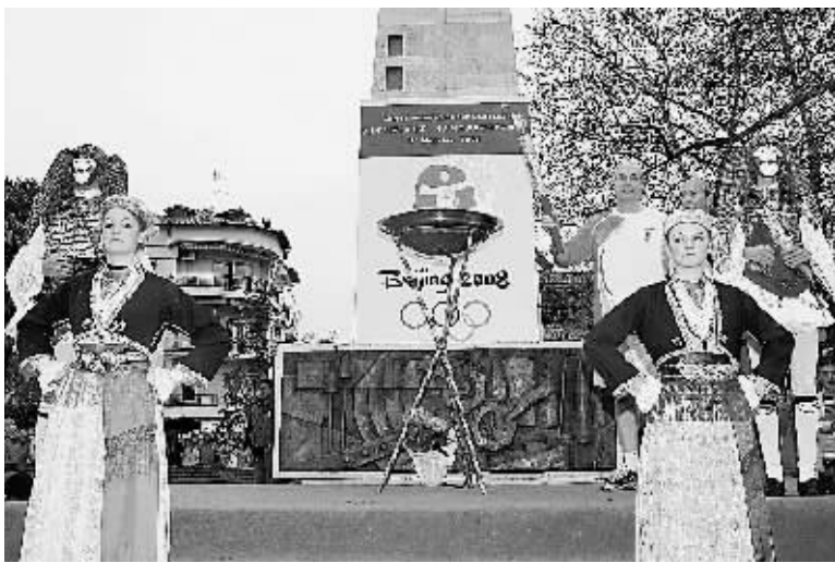
3月27日,纳乌萨市的火炬手(后排右三)在城市庆典中展示火炬。当日,北京奥运会圣火在希腊境内进行第四天传递。

另外,《致富招招鲜》《精彩剧场》《影评视界》等栏目将于每天晚间依次亮相,而农民朋友们喜爱的《乡村剧场》将在每天上午10:40开播。