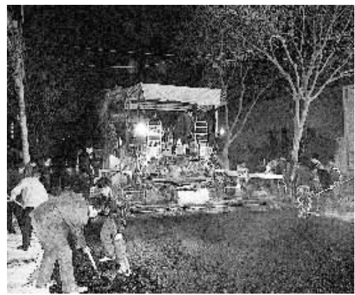
二七区市政设施管理所组织抢修队连续奋战4个通宵,整修道路东段2000多平方米坑洼破损的路面,昨日清晨,一段平整畅通的柏油马路展现在市民面前。

公安、市政成立10个联合纠查组,24小时对公交车、出租车的行车秩序、停车秩序进行纠查。对公交车、出租车交通违法行为,民警除依法予以处罚外,公交总公司、出租车客运管理处纠察人员还要予以登记,进行内部处罚;对无理取闹、阻碍民警执法的交通违法行为人将依法拘留。