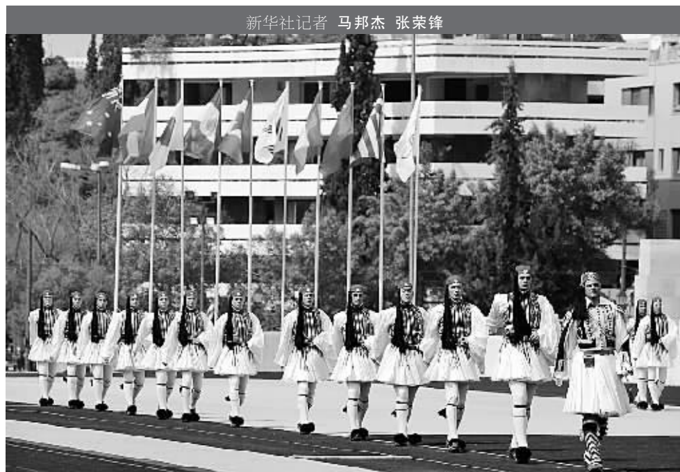
新华社记者 马邦杰 张荣锋

正如国际奥委会《奥运会火炬接力技术手册》所言：奥林匹克火炬接力所代表的价值观被全世界人民普遍接受和赞美，人们认为“世界上没有任何一种力量能像奥林匹克火炬接力那样将全世界人们连接在一起”。神圣的“和谐之旅”将促进世界文明的融合，促进各地人民之间的互相认同和尊重，为世界和平作出自己的贡献。