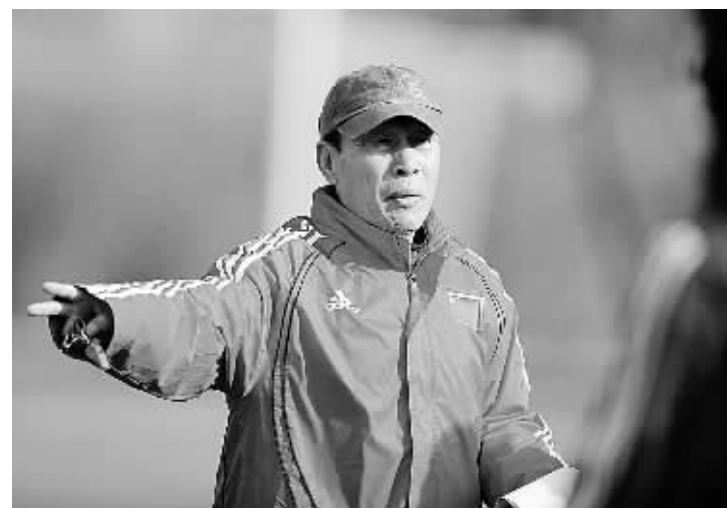
3月30日，中国女足新任主教练商瑞华在指导队员训练。为了备战北京奥运会，中国女足于3月27日至5月8日在河北省香河国家足球训练基地集训，在此期间还将进行多场热身赛。