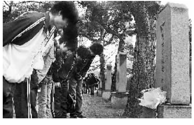
3月30日，大学生向烈士墓鞠躬。当天，沈阳大学美术学院的500多名师生在沈阳抗美援朝烈士陵园开展“认亲”扫墓活动。学院的51个班级在烈士陵园认下51位没有亲人扫墓的“烈士亲人”，一一对应为烈士扫墓。