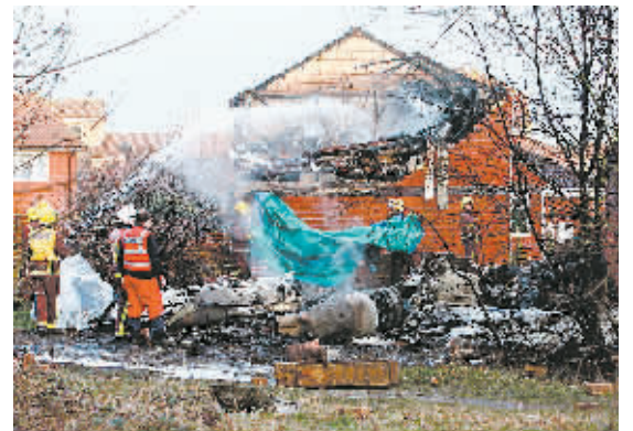
3月30日，消防人员在英格兰东南部肯特郡法恩巴勒镇的飞机坠毁现场灭火。当日，英国一架私人飞机在法恩巴勒镇坠毁并与民宅相撞，造成5人丧生。