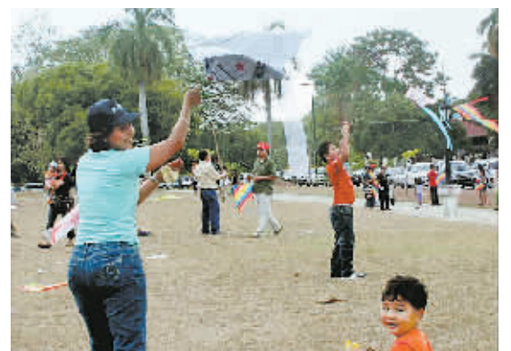
3月30日，一对母子在巴拿马首都巴拿马城著名的旅游景点长堤放风筝。当天，华人社团举办风筝节，庆祝巴拿马第五个“华人日”。均为新华社发