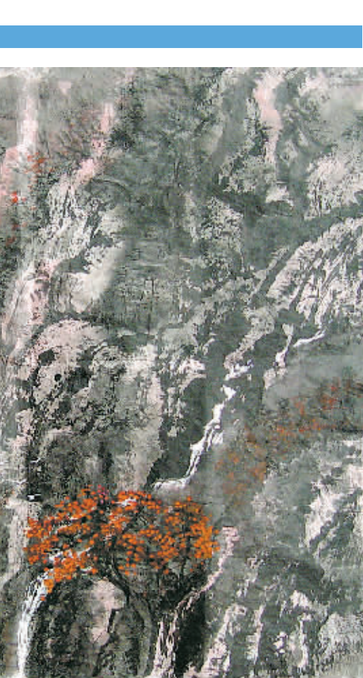
幽谷(中国画) 高复兴

到少欲、寡欲、慎欲、制欲，最终达到“无欲则刚”的精神境界。“海纳百川，有容乃大；壁立千仞，无欲则刚”出自郑板桥的对联。它的含义是：要豁达大度、胸怀宽阔、千仞峭壁之所以能巍然屹立，是因为它没有世俗的欲望；借喻人只有做到没有世俗的欲望，才能达到大义凛然(刚)的境界。清朝两广总督林则徐在查禁鸦片时期，亲笔手书了这副堂联以自勉，表现了他伟岸铁骨的宽阔胸怀、刚正不阿的浩然正气。人一旦能够做到虚怀若谷，便能够汇集百川而成大海；人如果能做到无欲无争，便能如峭壁一般，屹立云霄。人生少一点欲望，就会多一点轻松；少一份奢求，就能多一份刚强！人之大凡不“刚”，细究根源，背后都是一个“欲”字在从中作祟。古人云：“心为形所累。”欲望越大，压力越大，欲望越强，枷锁千钧，人一跌入“欲”的深渊，无法自拔，就会腐蚀心灵，堕落良知，以致使人成为欲望的奴隶。现实生活中为欲伤身、败名、丧节的人比比皆是，利欲熏心的人永远无法作出品德高尚的行为，更无刚强可言。