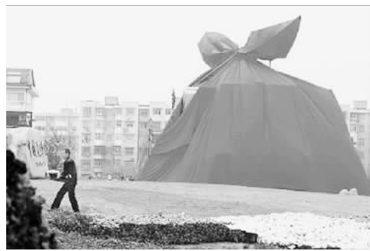
6日,在杭州中国美院象山校区门口,一幢待拆迁的房子被包成了一个高约20米的大红“礼包”。“大礼包”用了2000多平方米的红布。这是美院80周年校庆的一件装置作品,据称是为了表达对杭州的感激之情。