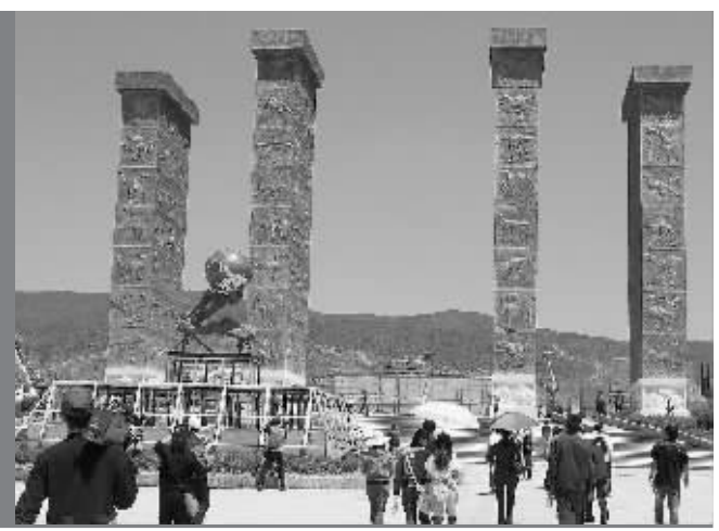
这是云南禄丰“世界恐龙谷”入口处(4月6日摄)。位于云南省禄丰县的“世界恐龙谷”旅游景区将于4月18日正式开园迎客。该主题公园规划面积4平方公里,汇集了60具恐龙骨骼化石,堪称世界奇观。