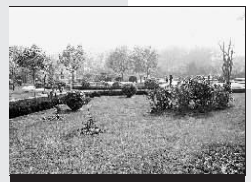
为迎接拜祖大典,经纬广场打扮得焕然一新。

在礼台前侧和观众席后侧,共有左右对称的12棵古枣树,据标签标识,这些枣树均有500岁高龄了。在这些枣树上,挂满了来自全国各地人们的祈福牌,有的像中国结,正面是黄帝的画像,背面是市民的祈福:“愿祖国昌盛、家庭幸福”、“祈福平安幸福”、“祝愿全家人身体健康”、“愿人民生活水平越来越高”、“愿祖国明天更美好”……每棵树上都有几百个祈福牌在随风飘扬,成了一棵棵开满“花”的树、祝福的树。