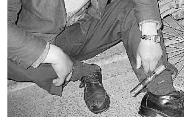
昨日凌晨2:30,秦岭路上,一醉酒男子怕电动车被偷,将车锁在自己腿上,坐在路边呼呼大睡。本报记者 刘玉娟 摄