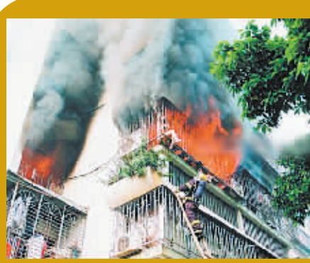
22日下午4时许,深圳华富北村76栋3楼一住宅发生火灾,浓烟滚滚,房子里有个女子被浓烟逼到阳台的防盗网上,进退不得,命悬一线。消防部门出动7台消防车扑救。最终,大火被扑灭,女子被救下。 据《深圳特区报》