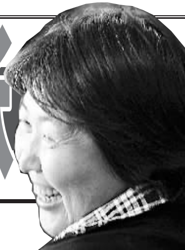
久远的微笑

个股报收于涨停价位。市场人气重聚令交易异常活跃,沪深两市分别成交1958.15亿元和772.10亿元,总量超过2730亿元,在前一交易日大幅增长的基础上再度猛增一倍以上。权重指标股板块当日全线大幅走高。其中,“A股第一权重股”中石油涨幅达到9.87%,工行和建行涨幅分别达到7.92%和9.69%。权重排名前20位的个股中,中石化、中国神华、中国人寿、中国平安、中国铝业、中国远洋等10只个股涨停。当日所有板块均出现整体大幅上涨,涨幅相对较大的板块包括建筑业、仪器仪表、有色金属、能源、钢铁、交通运输等。