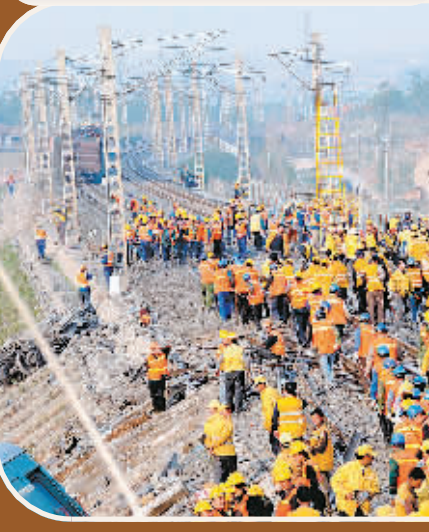
受损线路铁轨重新铺设工作完成。