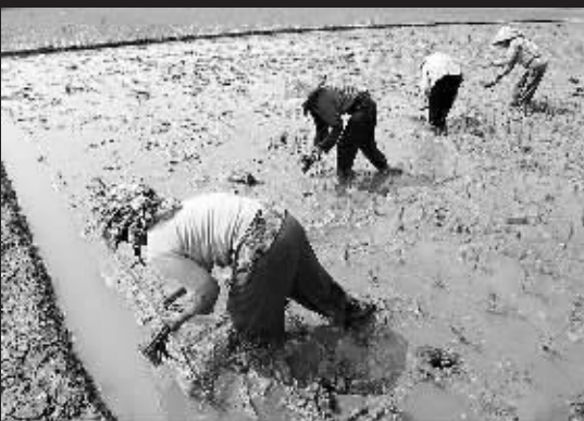
东南亚国家联盟10国贸易部长5月3日在印尼巴厘岛达成共识,同意就大米市场展开合作。图为4日,在印尼西爪哇省,人们在稻田里插秧。

事故发生后,当地党委、政府高度重视,相关部门立即赶到现场指挥抢救。11时10分,被困井下的9名矿工中有5名获救。记者从娄底市煤矿安全监察分局了解到,截至19时,对4名失踪矿工的搜救工作还在紧张进行中。