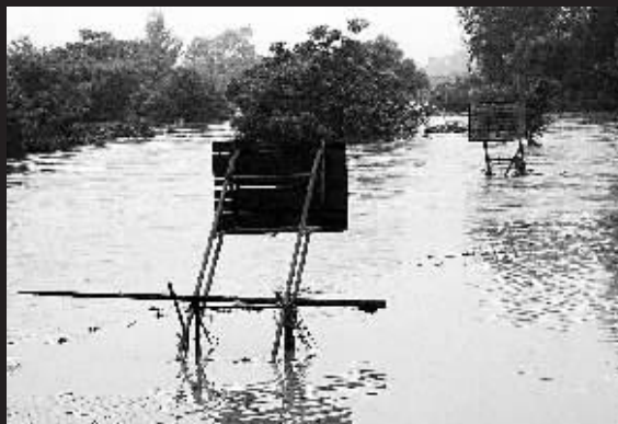
5月4日1时至7时,广西北海市合浦县沿海白沙、公馆等镇骤降暴雨,两镇降雨量分别达369毫米和282毫米。图为被洪水浸泡的白沙镇中心小学的篮球架。