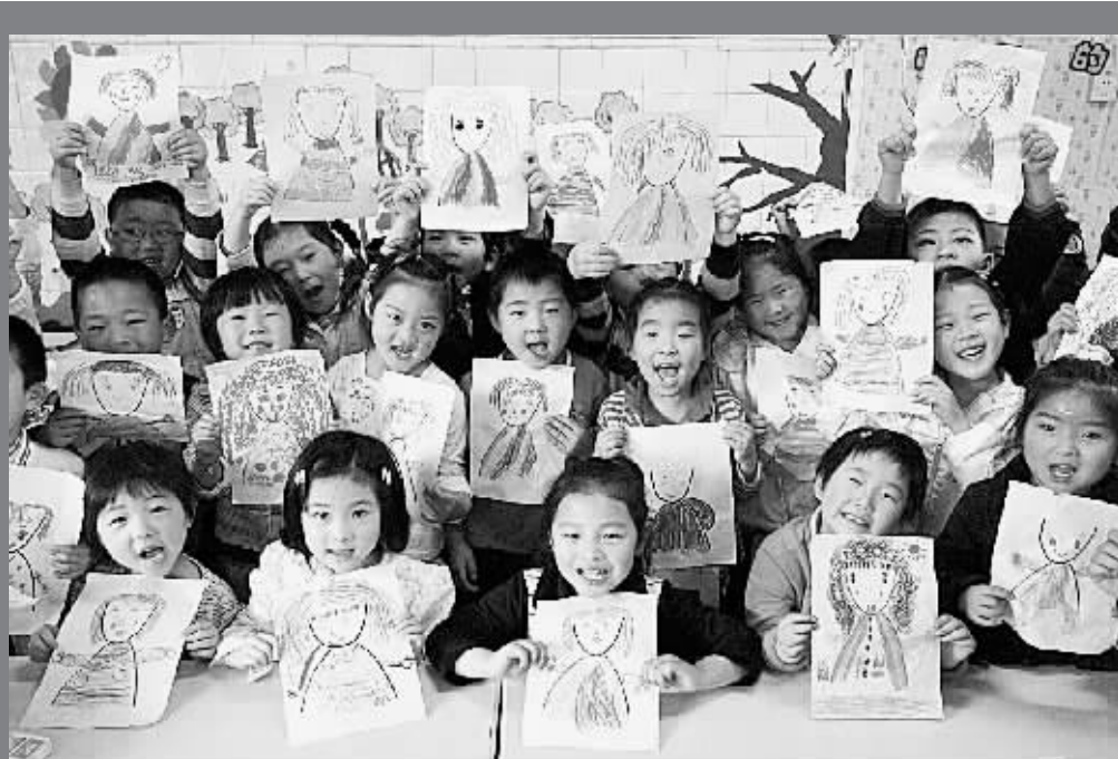
5月6日,小朋友们展示自己画的“漂亮妈妈”作品。 当日,苏州市虹桥幼儿园开展以“我的漂亮妈妈”为主题的特色绘画课。孩子们在老师的指导下,为妈妈画肖像,迎接即将到来的母亲节。