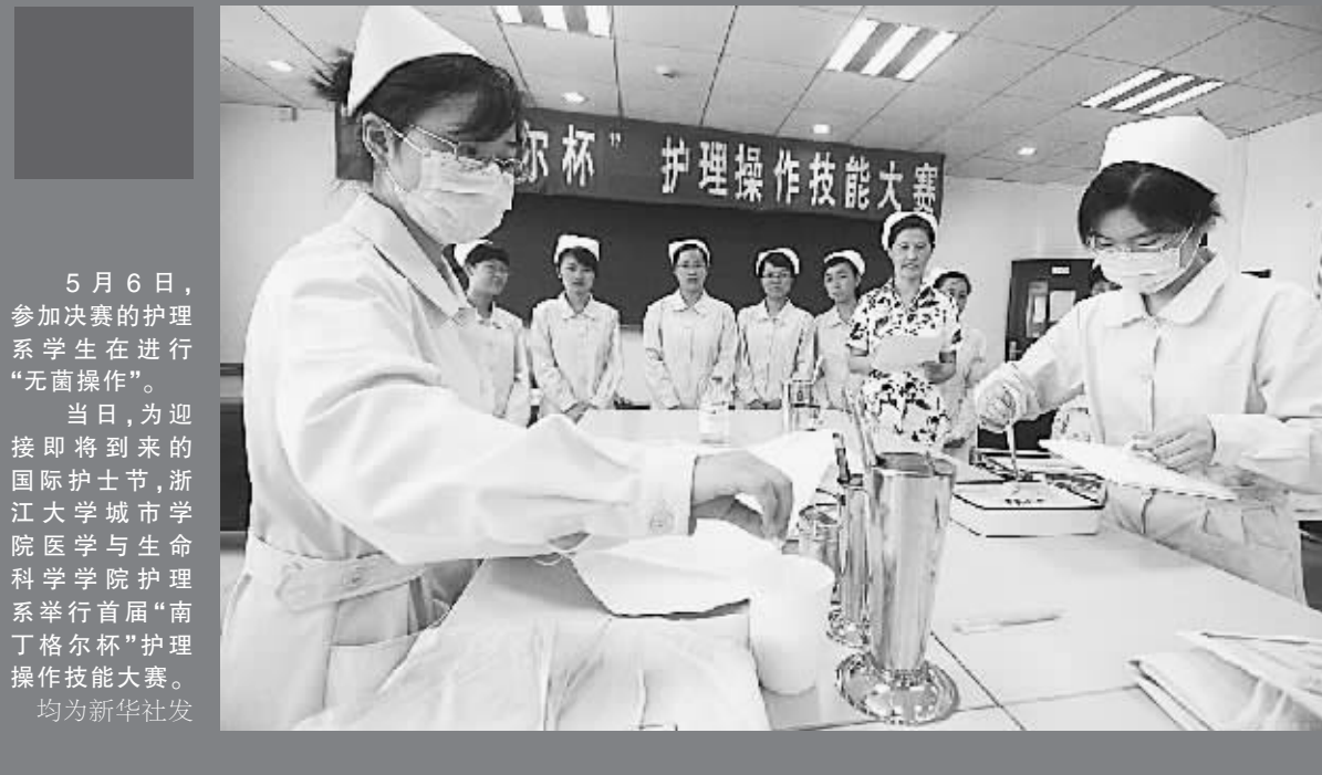
5月6日,参加决赛的护理系学生正在进行“无菌操作”。 当日,为迎接即将到来的国际护士节,浙江大学城市学院医学与生命科学学院护理系举行首届“南丁格尔杯”护理操作技能大赛。均为新华社发