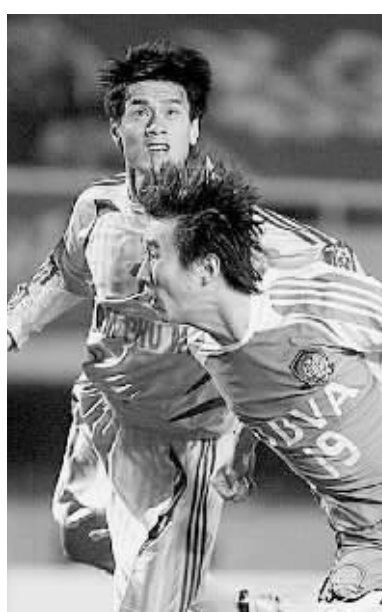
7日，在2008年亚洲冠军联赛小组赛第五轮比赛中，北京国安队以3:0战胜越南南定队，出线基本无望。在另外一场比赛中，长春亚泰队5:0战胜越南平阳队，将悬念留在最后一轮。 网文摄