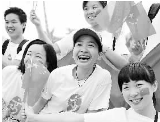
广州群众为奥运圣火传递活动加油。