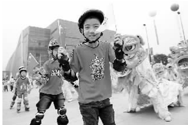
少年儿童在起跑仪式上进行轮滑表演。