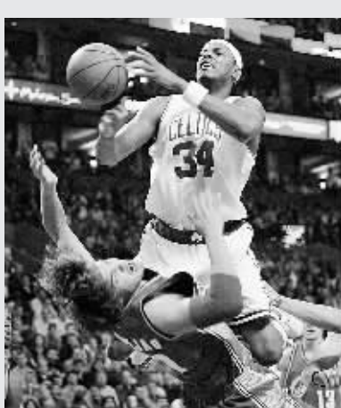
5月6日，凯尔特人队球员皮尔斯(上)带球突破。当日，在NBA联赛东部半决赛中，凯尔特人队主场以76:72战胜骑士队。

敌5，他可以凭借一己之力将湖人队送进季后赛……他似乎无所不能，但他终究无法再与总冠军戒指续上前缘。科比进入NBA已经12年了，在这12年中，他高兴过，也痛苦过；他出色过，也黯然过。随着时间的推移，科比逐渐成熟，他也终于明白，篮球是一个整