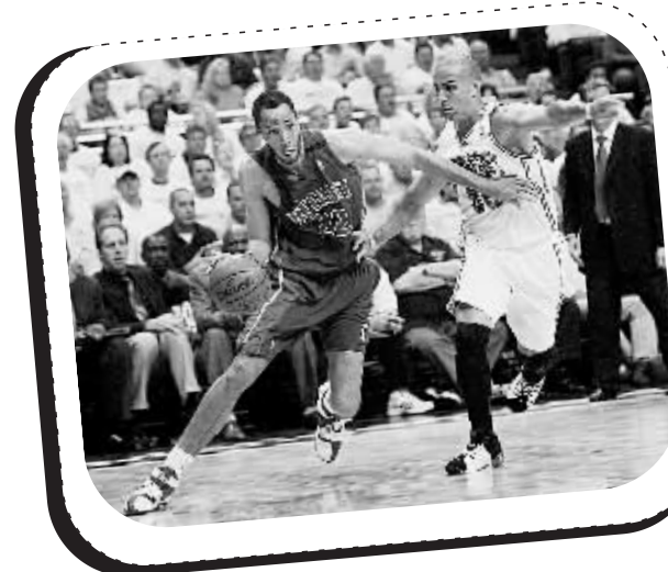
上图:5月7日,活塞队球员普林斯(左)带球突破。当日,在NBA联赛东部半决赛中,魔术队主场以111:86战胜底特律活塞队,将大比分追成1:2。

大学生们通过网上讨论纷纷表达自己的喜悦之情、为祖国科技进步感到的振奋、自豪之情,并表达出希望亲历奥运圣火传递、参与奥运志愿服务的心声。