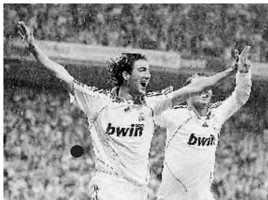
5月7日,皇家马德里队球员伊瓜因(左)和队友庆祝进球。当日,在2007/08赛季西班牙足球甲级联赛第36轮的一场比赛中,皇家马德里队以4:1战胜巴塞罗那队。

象征着团体力量的市直机关拔河比赛进行得如火如荼,在雨中各支代表队的大力士们使出全身力气,比赛下来每人身上都裹着泥巴,但他们的笑容却是最真切的,运动员用顽强的拼搏精神和不服输的韧劲构成难得的“雨中即景”。今天,拔河比赛将产生最后的冠军得主。