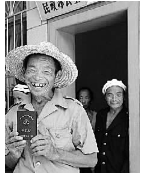
低保户在乡民办公室领到城乡最低生活保障金。

3月25日~4月13日 七届全国人大一次会议举行。会议通过了宪法修正案，将“国家允许私营经济在法律规定的范围内存在和发展，私营经济是社会主义公有制经济的补充。国家保护私营经济的合法权利和利益，对私营经济实行引导、监督和管理”以及“土地的使用权可以依照法律的规定转让”等规定载入宪法。 9月26日~30日 中共十三届三中全会在京举行。全会批准了中央政治局提出的治理经济环境、整顿经济秩序的措施，确定1989年、1990年工作重点为治理经济环境和整顿经济秩序。