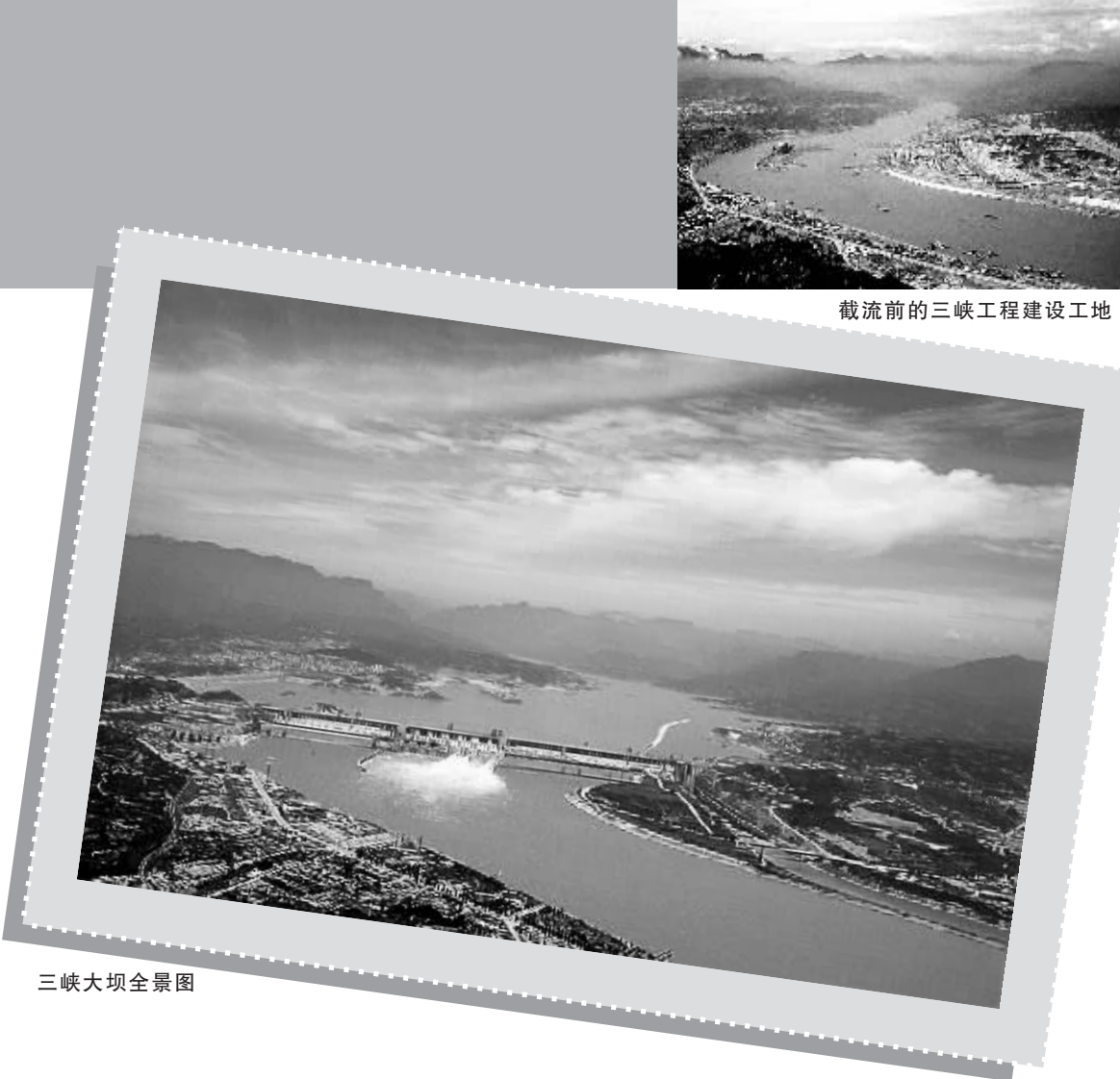
截流前的三峡工程建设工地

1月1日 《人民日报》发表社论《把主要精力集中到生产建设上来》。同日，全国人大常委会发表《告台湾同胞书》。国防部长徐向前发表声明，从即日起，停止对大金门、小金门、大担、二担等岛屿的炮击。 1月1日 中美两国正式建交。 1月29日~2月5日 邓小平副总理应邀对美国进行正式访问。这是建国以来中国领导人第一次访问美国。 7月15日 中共中央、国务院批转广东省委和福建省委关于对外经济活动实行特殊政策和灵活措施的两个报告。同时决定，先在深圳、珠海两市划出部分地区试办出口特区，待取得经验后，再考虑在汕头、厦门设置特区。拉开了我国对外开放的帷幕。1980年5月16日，中共中央、国务院批转《广东、福建两省会议纪要》，正式将“特区”定名为“经济特区”。