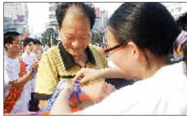
右图 二七塔下,到处可见热情捐助的人群。