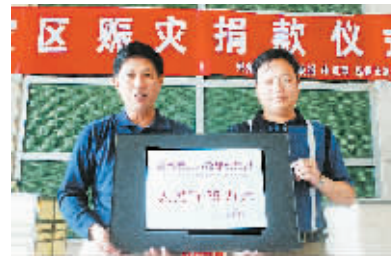
市第二市政建设集团在郑州日报社新闻大厦捐款 35 万元。