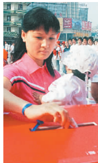
母亲怀抱婴儿来献爱心