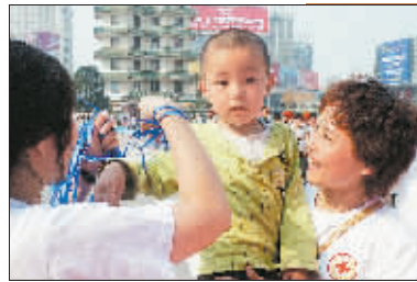
左上/左下 给每个到场的爱心市民系上蓝丝带。