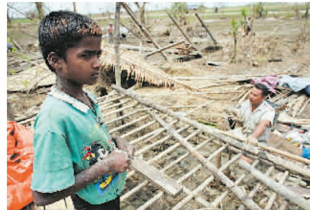
5月16日,在缅甸仰光的一个村庄,一名儿童看着大人搭建简易住房。

陆。 吴敦义表示,吴伯雄主席充分感受到胡锦涛总书记推动改善两岸关系的诚意与善意。吴主席此行除了会再度代表中国国民党及台湾各界对大陆遭遇空前的地震劫难表示慰问之外,也会务实地提出两岸互惠双赢的见解。