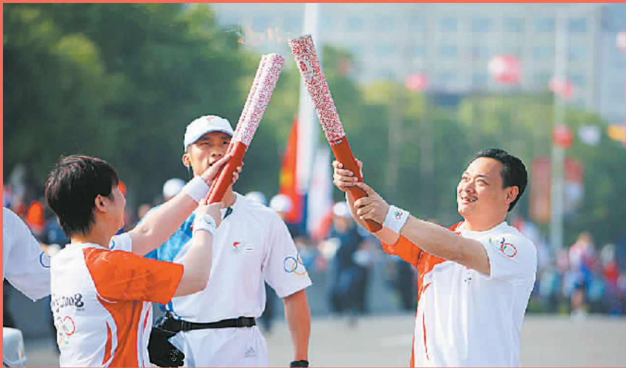
5月17日,第一棒火炬手、奥运冠军占旭刚(右)与下一棒火炬手戴丽丽交接。当日,奥运圣火在温州传递。