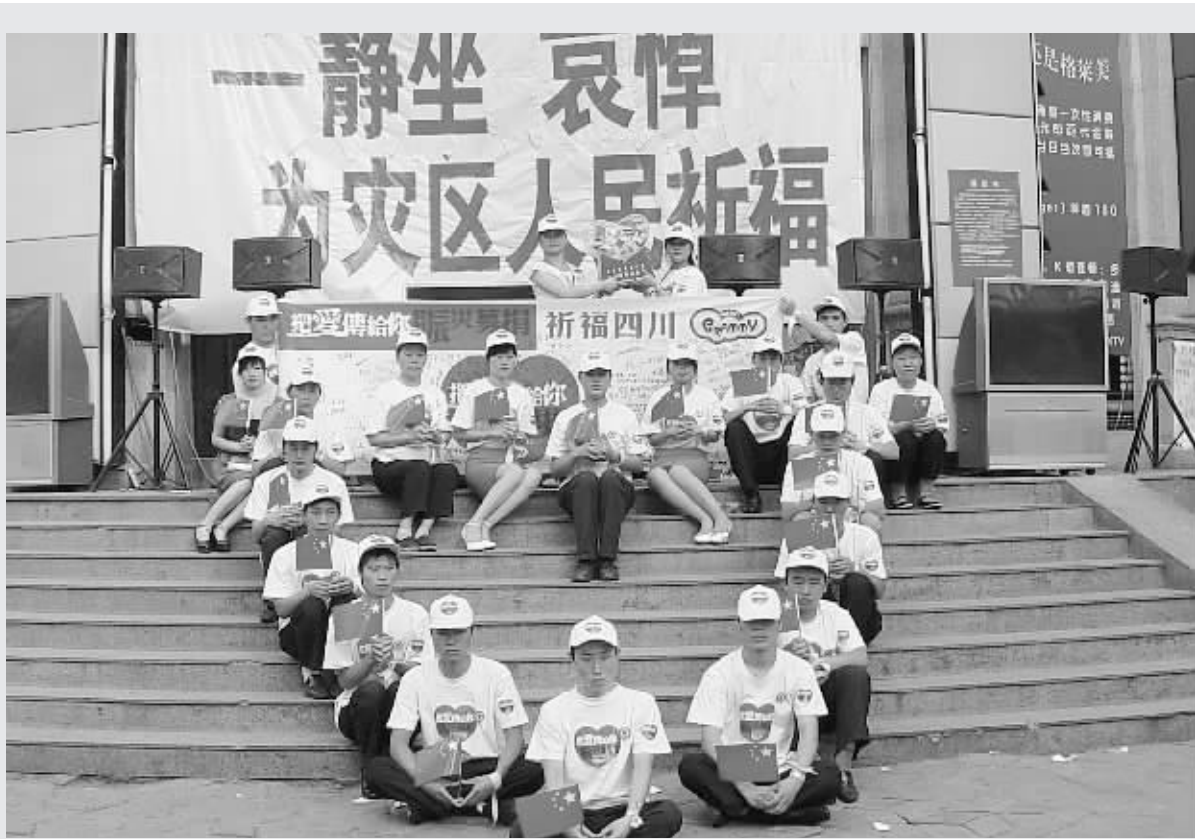
昨日是“全国哀悼日”的第二天,下午,郑州大学东门对面,十几名年轻人在一家商场门前台阶上静坐,组成一颗“心”的形状为灾区人民祈福。并协助郑州红十字会进行现场募捐。

据施工方江苏省第一建筑安装有限公司中州公司负责人钱小祥介绍,工程项目部有四川籍民工180多名,在地震发生后,他们就积极帮助川籍民工与家人进行联系,在了解到一部分川籍民工家里出现了房屋倒塌、损毁等情况后,公司立即准备了20万元慰问金,组织专车把80名重灾区的川籍民工送回了家。对于留守工地的川籍民工,他们也积极通过安装卫星电视,让他们带薪休息等形式进行安抚,并发动公司员工为川籍民工募捐10多万元,目前川籍民工情绪稳定。