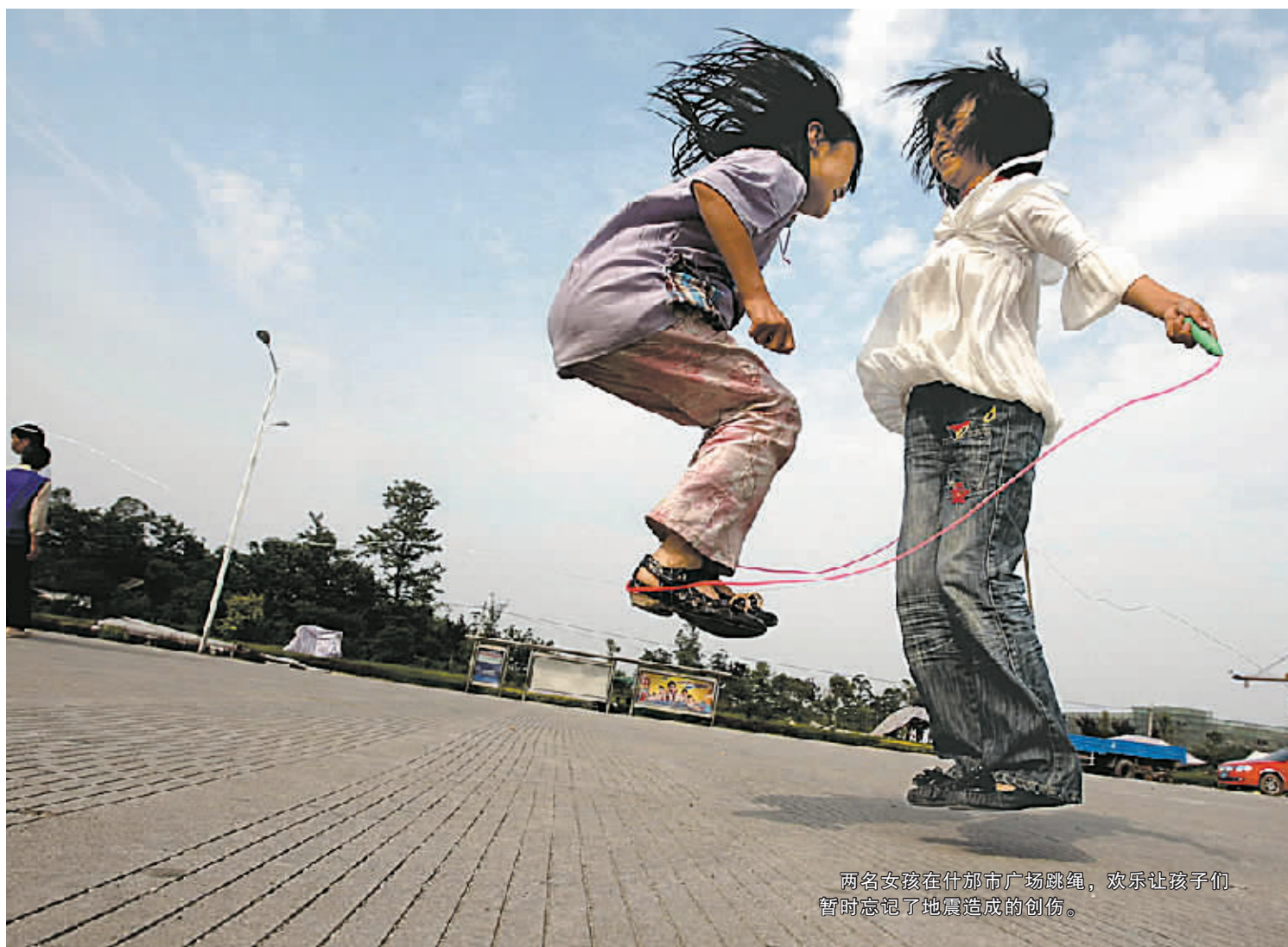
两名女孩在什邡市广场跳绳,欢乐让孩子们暂时忘记了地震造成的创伤。