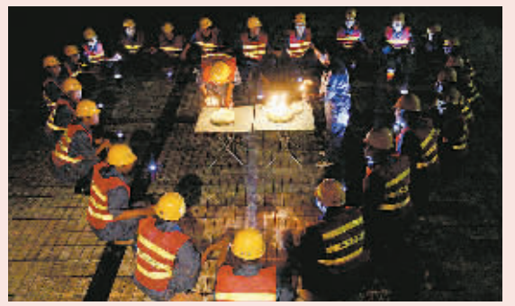
救援队员围成心形，为本报记者和一名队员祝福生日，并祝愿灾区人民早日渡过难关。

今天是我29岁的生日，没能陪在父母身边孝敬二老，特别是生病中的爸爸，我觉得愧疚。5月19日从郑州来到灾区，每天都会收到千里之外的祝福，让我感动；奔走在绵竹的大街小巷，看着灾区亲人无助、渴望的眼神，让我更加坚定信念：一定要承担起记者的职责，承担起媒体的责任，让它的力量释放更多爱的能量，帮助灾区亲人早日健康安居，让孩子重返校园。