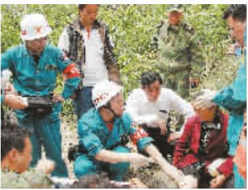
我省医疗救援队在灾区现场急救群众。

本报绵竹专电(特派记者 张丽霞)记者昨日了解到，绵竹中学600多名高三学生已转移到德阳七中恢复上课。该市其他学校的教学也正在恢复中。 据了解，绵竹中学共有3100多名学生和228名教师，此次大地震导致学校所有教学楼都成了危房。为了学生和教师的安全，该校决定转移600多名高三学生和60名教师到德阳七中继续上课。