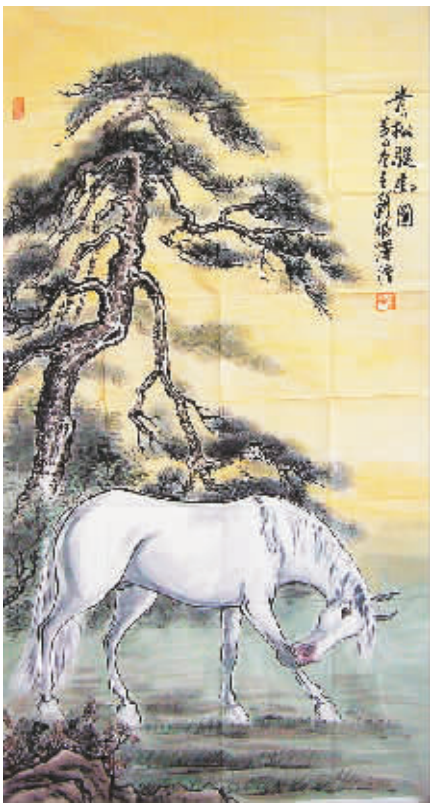
青松骏马图(国画) 福泽

望眼欲穿的广播响起来了,却兜头给她们浇了一瓢冷水:“因为大雪封路,临客2228次列车晚点,请稍候通知……”完了,完了!许多趟车都是先晚点后取消,看来这趟2228同样!嫂子呻吟着想往地上蹲。她赶紧拽她起来,说:“可不