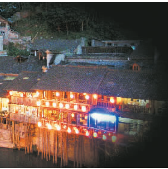
风风雨雨

打碎了我的灯笼 雾漫过堤坝 不管怎么说 还是狗见着狗亲 鸟儿的叫声一片唱和 无论何如 你不敢想象 蛛网能将雾的足迹抓到 我不敢将思想拔高 即便蛛网有时 很像一架水车 借助阳光 我也不能把雾割折得 更加周全 漫过堤坝 它们就走远了