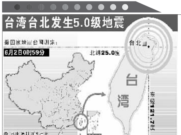
台湾台北发生5.0级地震

当日，“我们的节日·端午节”主题文化活动暨第三届中国汨罗江国际龙舟邀请赛在湖南汨罗市举行。来自澳大利亚、荷兰以及中国各地的十几支龙舟队在汨罗江参加角逐。汨罗是中国古代伟大诗人屈原晚年生活、创作和投江殉国之地。