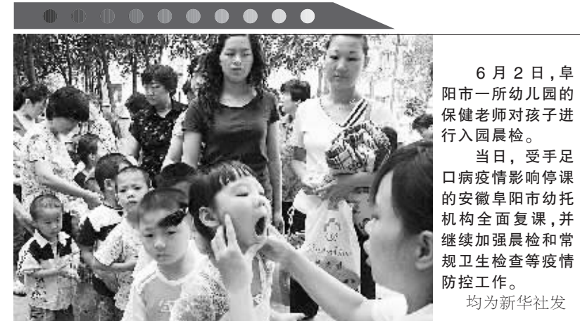
6月2日，阜阳市一所幼儿园的保健老师对孩子进行入园晨检。

当日，受手足口疫情影响停课安徽阜阳市幼托机构全面复课，并继续加强晨检和常规卫生检查等疫情防控工作。