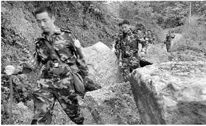
6月2日，来自成都印钞公司的民兵在都江堰市赵公山附近搜寻5月31日失事的直升机。

新华社成都6月2日电(记者冯昌勇 余晓洁)记者2日从四川省人民政府新闻办公室了解到，截至目前，5月31日14时56分在汶川县映秀附近执行任务时失事的米-171运输直升机及人员尚未被发现。搜寻工作仍在继续。