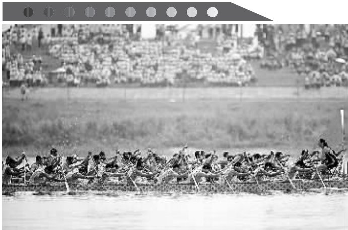
6月2日，龙舟队员正在参加龙舟赛。

当日，“我们的节日·端午节”主题文化活动暨第三届中国汨罗江国际龙舟邀请赛在湖南汨罗市举行。来自澳大利亚、荷兰以及中国各地的十几支龙舟队在汨罗江参加角逐。汨罗是中国古代伟大诗人屈原晚年生活、创作和投江殉国之地。