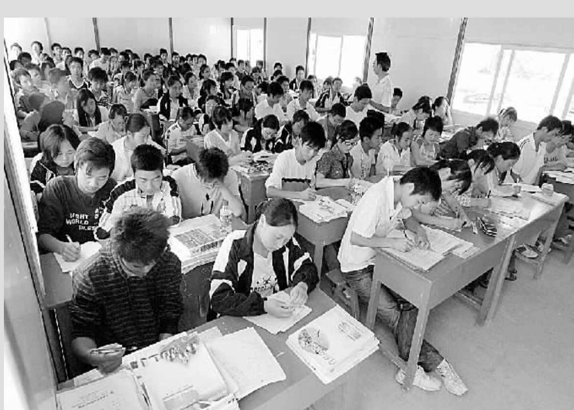
6月2日，陕西省重灾区宁强县一中高三年级学生在新搭建的活动板房教室内学习。根据陕西省政府决定，陕西地震灾区所处的宁强、略阳两县高考将如期举行，考生们将在活动板房考场中参加高考。目前活动板房材料已经全部运到，工作人员正在搭建考场，部分学生已经可以在“新教室”中进行最后的高考冲刺。

据了解，这次天气灾害使全市许多地区不同程度受损，以油菜、秧苗、玉米等为主的农作物损失情况较为严重。