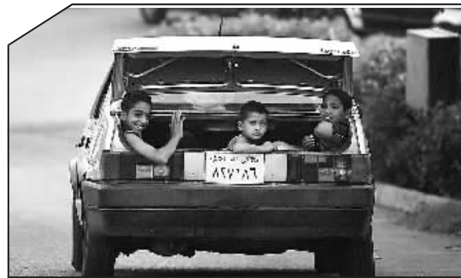
这是4月28日拍摄的一辆满载着埃及一家庭全体成员的汽车行驶在开罗的街道上。由于这家人成员太多,连汽车的后备箱也被用来充当座位使用。6月9日,埃及总统穆巴拉克说,如果不采取任何措施,埃及人口数量到2050年将从现在的7800万增长到1.6亿。

到国内强烈反对,引发一系列抗议活动。面对各方压力,韩国政府已宣布推迟执行这一协议。李明博的7名高级秘书6日已集体提交辞呈,以表示为此问题承担责任。7日,李明博还与美国总统布什就牛肉贸易问题通电话,要求布什采取有效措施,确保由美国出口至韩国的牛肉来自月龄不超过30个月的牛。 6月10日,韩国民众在首尔街头集会,抗议向美国开放牛肉市场。因担忧进口美国牛肉可能给韩国带来疯牛病隐患,约100万韩国人当天走上街头参加抗议(如图)。据总统办公室的一名发言人说,在韩升洙递交辞呈后,李明博要求他“采取所有可能的安全措施以防止当晚的集会出现任何不测或不幸事件”。