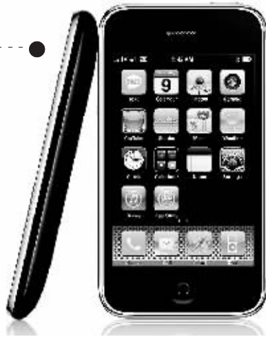
这是苹果公司6月9日发布的3G版iPhone手机的宣传图片。新款手机上网速度更快,卫星导航技术更准确,价格将比现在销售的手机下降200美元。3G版iPhone手机定于7月11日起在22个国家发售。

据美联社报道,俄克拉何马州议会正在考虑通过一项法案,要求州政府实行弹性工作制,推广每周4天工作制。提出这项议案的州参议员加里森说,州政府预算有限,政府工作人员收入不高,所以必须考虑如何能为他们节省汽油钱。