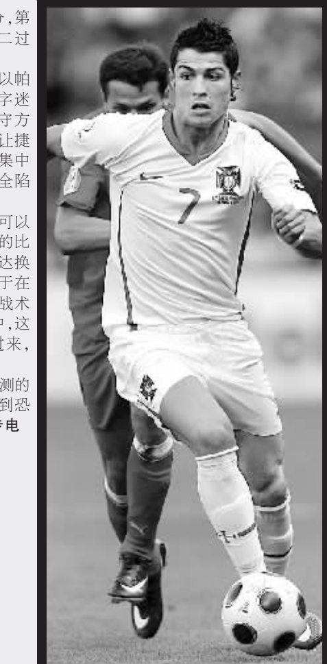
6月11日,葡萄牙队球员克·罗纳尔多(前)在比赛中带球突破。当日,在瑞士日内瓦举行的2008年欧锦赛A组第二轮比赛中,葡萄牙队3:1战胜捷克队。

拥有了这种弹性十足、变化莫测的战术,葡萄牙队将令任何对手感到恐惧。 新华社日内瓦6月11日专电