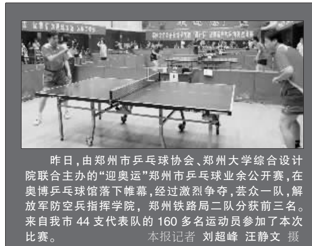
昨日,由郑州市乒乓球协会、郑州大学综合设计院联合主办的“迎奥运”郑州市乒乓球业余公开赛,在奥博乒乓球馆落下帷幕,经过激烈争夺,芸众一队,解放军防空兵指挥学院,郑州铁路二队分获前三名。来自我市44支代表队的160多名运动员参加了本次比赛。

本报讯(记者 陈凯)昨日,记者从市体育局获悉,由中国奥委会主办,郑州市体育总会和共青团郑州市委承办的“美利达”杯第十三届全国百城市自行车赛暨全民健身与奥运同行自行车赛(郑州赛区)将于6月22日在郑东新区CBD文化广场举行。 据悉,本次比赛分为老年组和青年组两个竞赛组别,两个组别的赛程均为10公里。