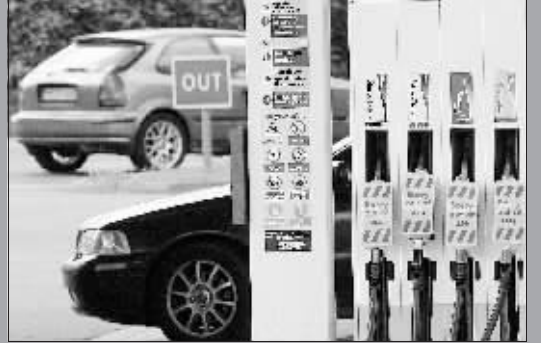
15日,在英国英格兰中部城市莱斯特,一个壳牌石油公司加油站的加油泵上贴着“无油可加”的标签。当日,英国联合工会的641名油罐车司机继续为争取更高薪金举行罢工,使全国数百加油站受到不同程度影响,有些加油站甚至出现断油。