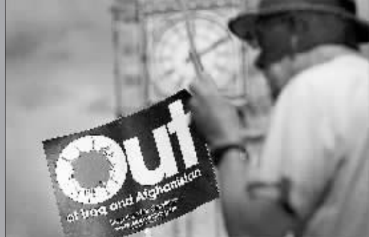
15日,一名示威者手持“离开伊拉克与阿富汗”的标语在伦敦大本钟前抗议美总统布什到访。布什当日下午抵达伦敦,开始访问。大约2500名示威者在伦敦抗议当年美英联手策划所谓“反恐战争”。英国警方说,示威人群和警方发生冲突,已有25人被逮捕。