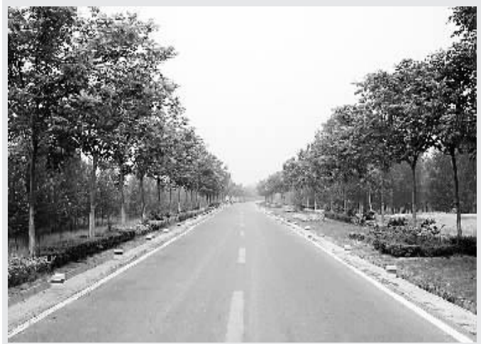
绿树成行的黄河大堤