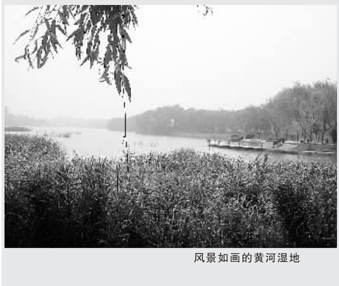
风景如画的黄河湿地