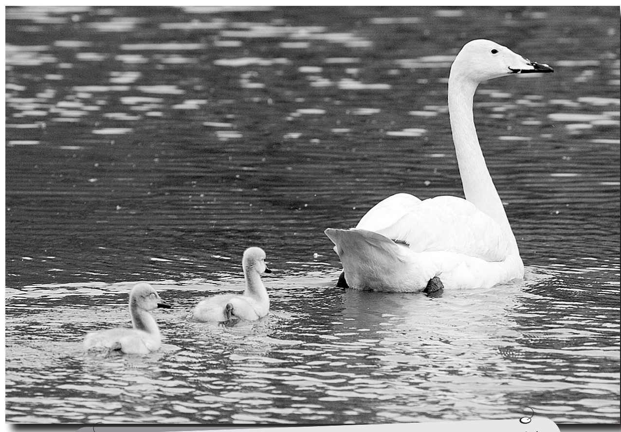
这是一只大天鹅带着宝宝游弋在秦皇岛野生动物园的涉禽湖内(21日摄)。日前，秦皇岛市野生动物园的一对大天鹅情侣在自然环境中孵育出两只天鹅宝宝。目前，在父母的精心照料下，两只天鹅宝宝正茁壮成长。

据新华社电 在教育部6月11日提出对口支援地震灾区中小学举办暑假夏令营的要求后，全国首家地震灾区儿童夏令营——“好孩子夏令营”近日在上海东方绿洲基地正式开营。来自四川省绵竹市土门镇小学五年级的20名小学生将接受集中、系统的心理关怀。与传统的夏令营不同的是，“好孩子夏令营”已由华东师范大学科研立项，采用国际上先进的心理干预模型进行科学干预。