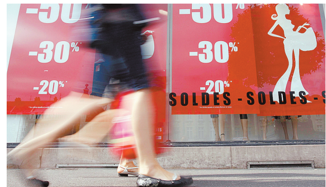
6月25日,在法国北部城市康布雷,行人从挂满打折广告的商店门前走过。法国一些地区已经开始了为期六周的夏季打折季。

据报道,台风“风神”20日晚袭击菲律宾包括首都马尼拉在内的十多个省份。暴雨和洪水至少造成229人死亡,700多人失踪,约37万人受灾。