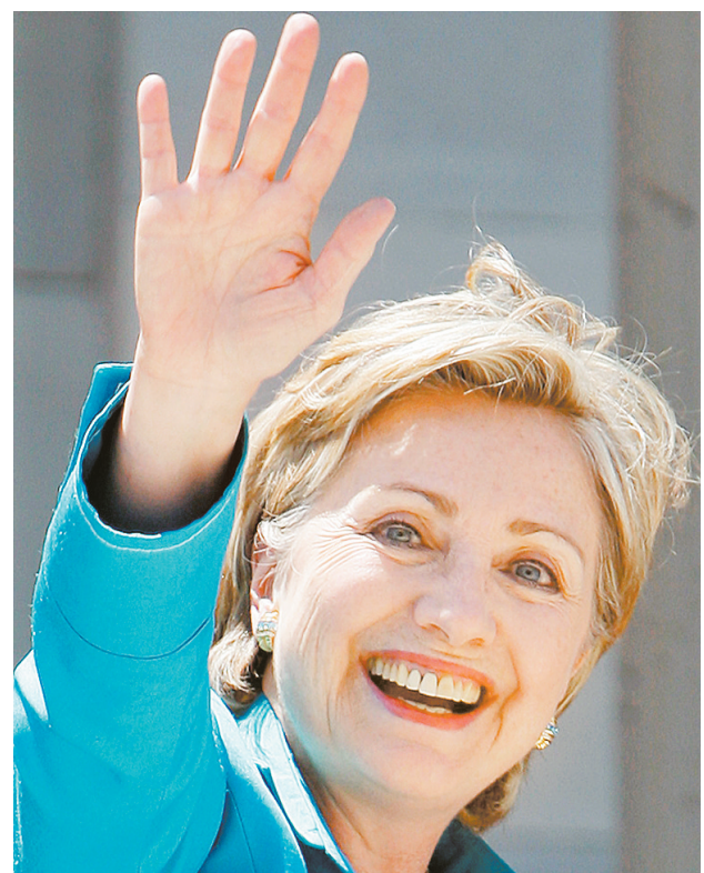
希拉里重返参议院

以地区论,百万富翁人数增长最快的分别是中东地区、东欧和拉丁美洲,增幅分别为15.6%、14.3%和12.2%。(新华社特稿)