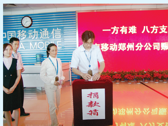
郑州移动员工积极为灾区捐款。

公司员工纷纷表示,捐助灾区,是每个公民的义务和责任,希望用自己的爱心为受灾群众送去一份温暖。